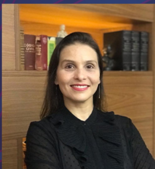
Betha Nova Palestrante